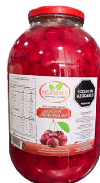
CEREZAS MARRASQUINO X 4.000g