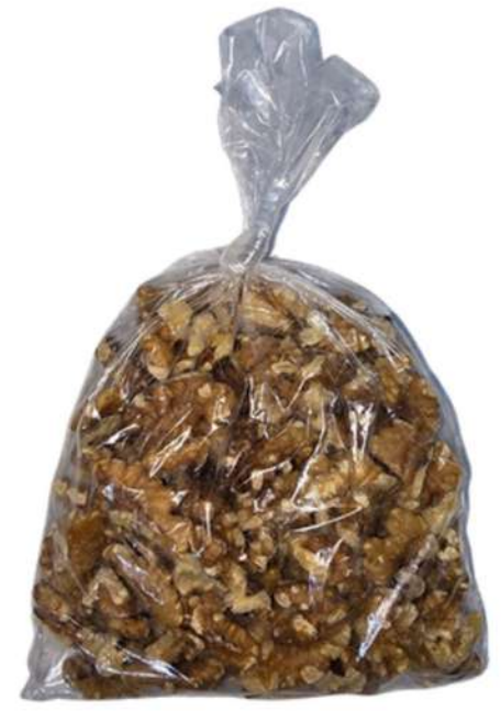
NUEZ DE NOGAL X 500g