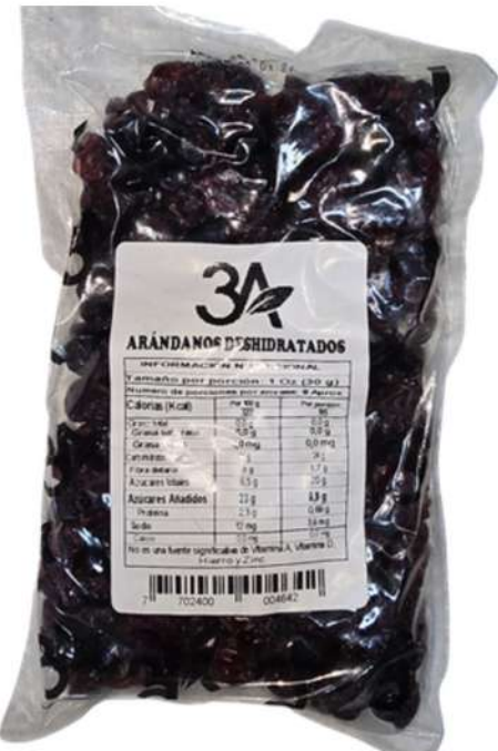
ARANDANOS X 500g