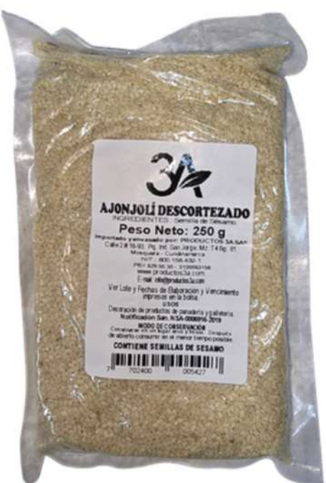
AJONJOLI DESCORTEZADO X 250g