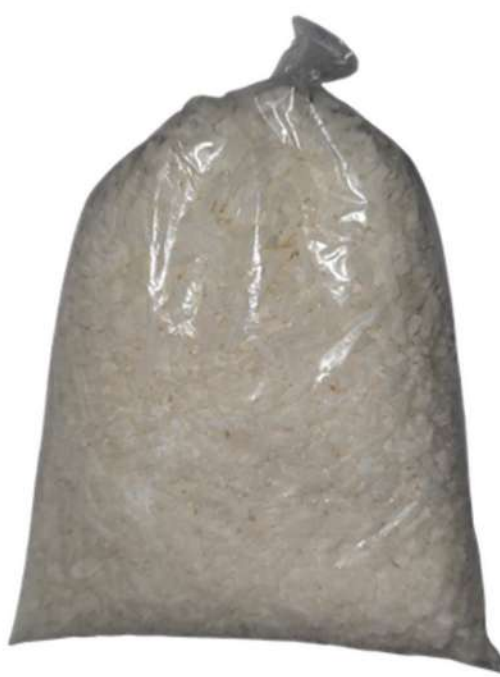
COCO DESHIDRATADO X 250g