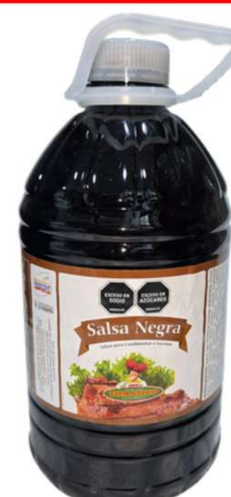
SALSA NEGRA X 3L