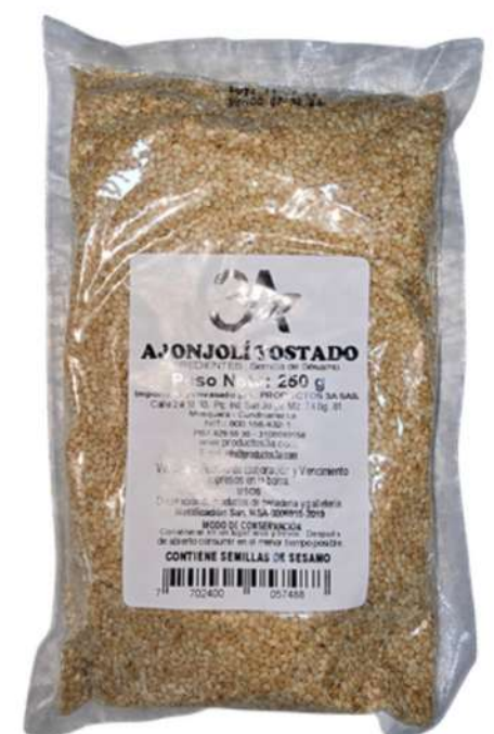
AJONJOLI TOSTADO X 500g