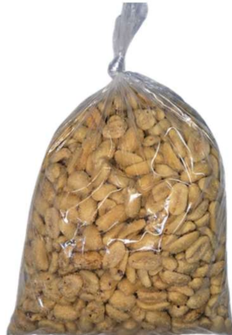
MANI DE SAL X 500g