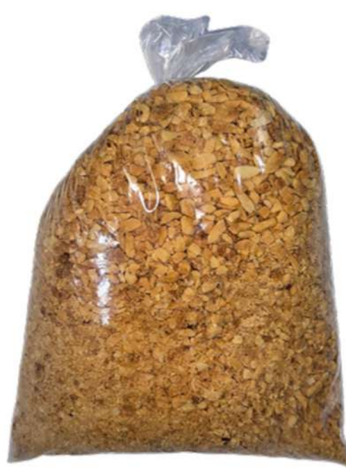
MANI TRITURADO X 500g