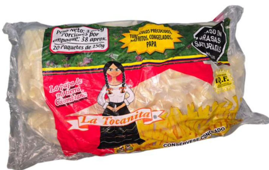
PAPA PRECOCIDA PORCIONADA X 3K X 20U