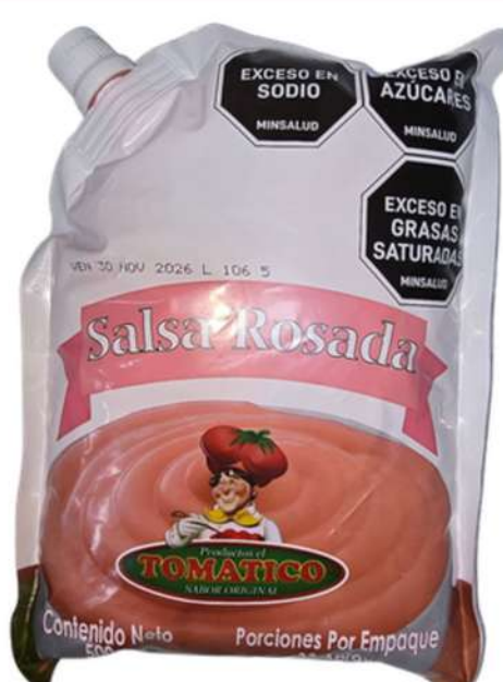
SALSA ROSADA TOMATICO X 1K