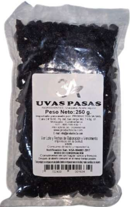
UVAS PASAS X 250g