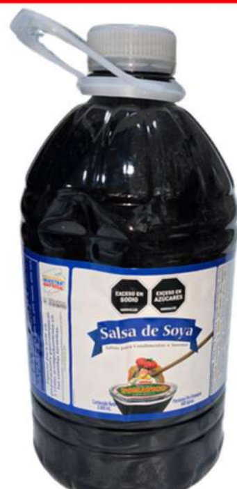
SALSA DE SOYA X 3L