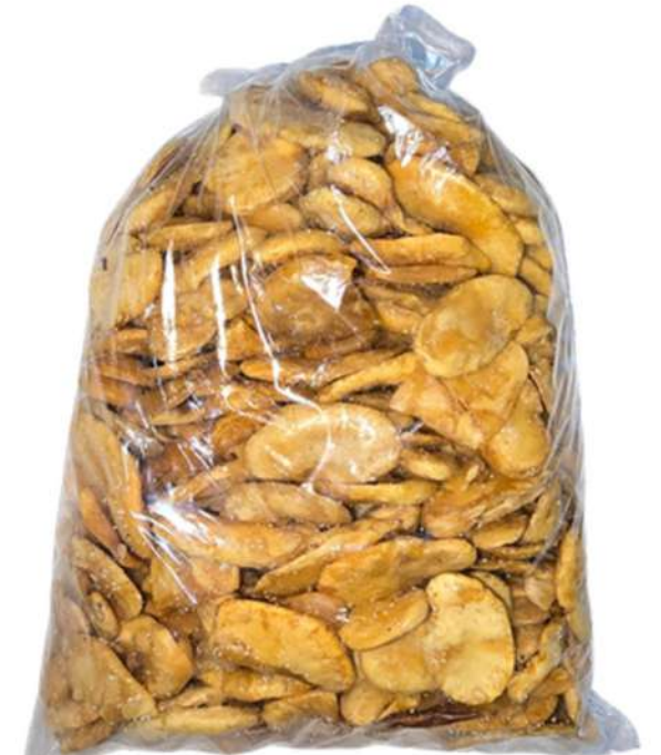
ABAS X 500g