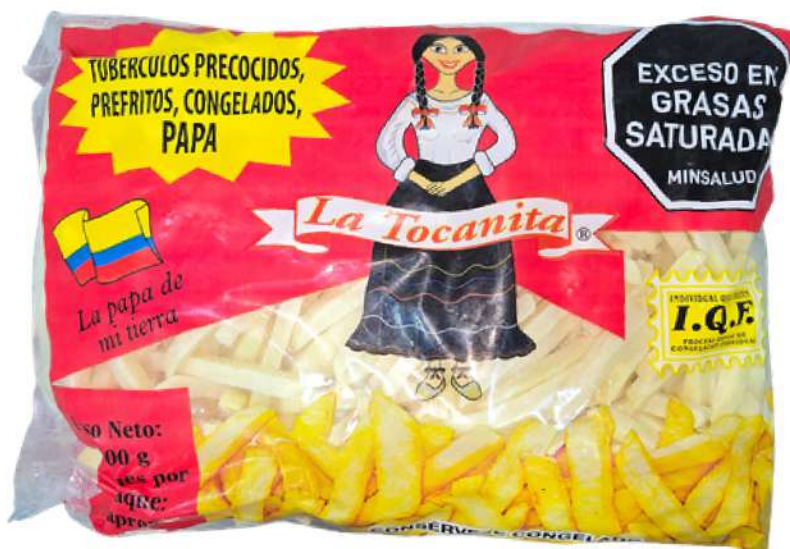
PAPAS PRECOCIDAS X 2.5K