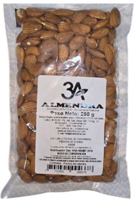
ALMENDRA X 500g