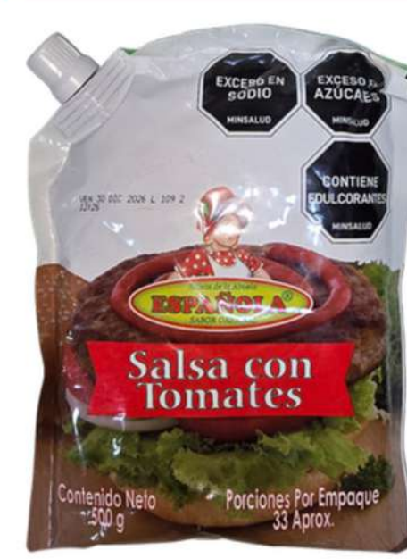
SALSA DE TOMATE ESPAÑOLA X 500g