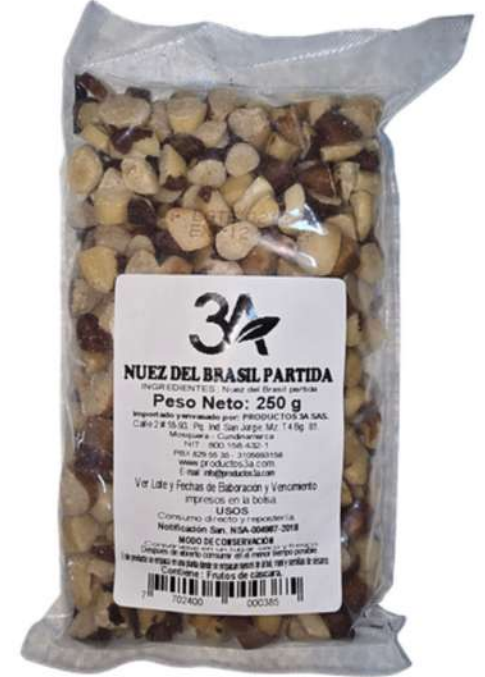
NUEZ DEL BRASIL X 250g