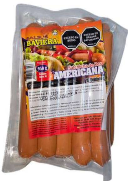
SALCHICHA AMERICANA X 15U