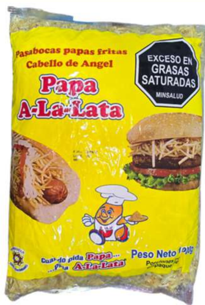
PAPAS FRITAS CABELLO DE ANGEL X 1K