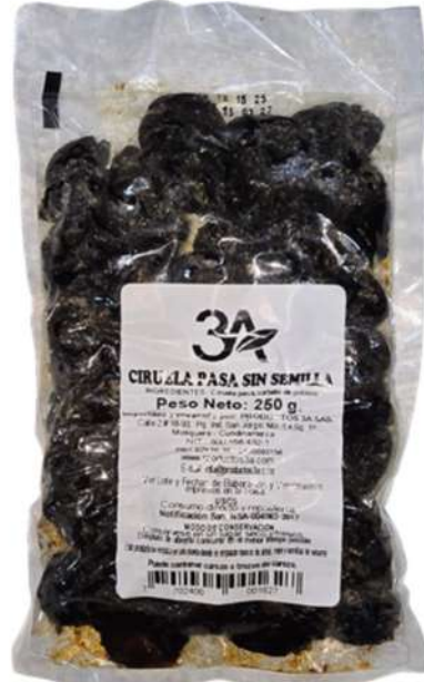
CIRUELA PASA SIN SEMILLA X 250g