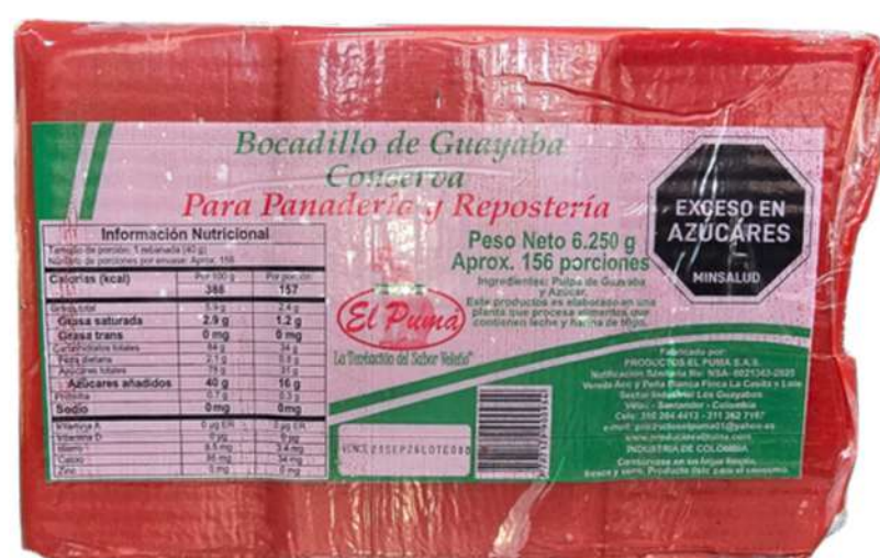
BOCADILLO DE GUAYABA CONSERVA X 6.250g