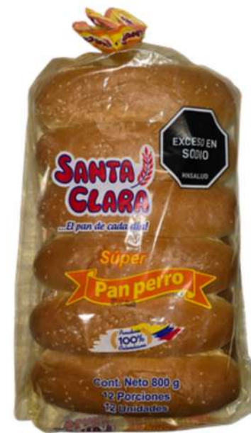
PAN PERRO X 12U SANTA CLARA