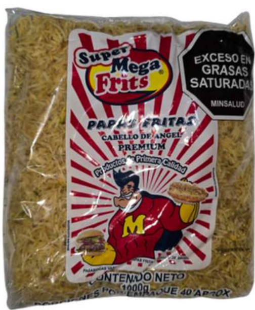
PAPAS FRITAS CABELLO DE ANGEL X 1K