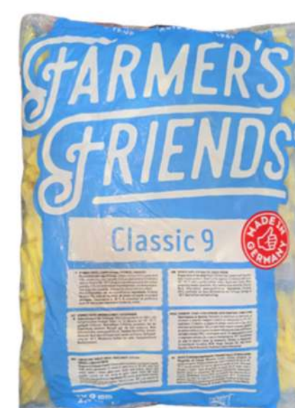
PAPAS PRECOCIDAS X 2.5K