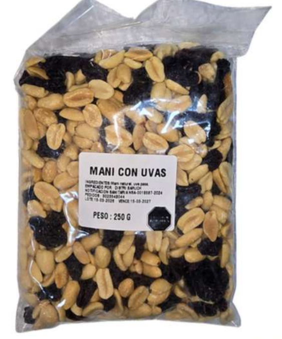
MANI CON UVAS X 250g