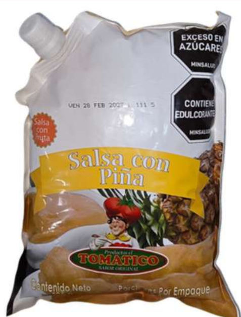
SALSA DE PIÑA TOMATICO X 1K