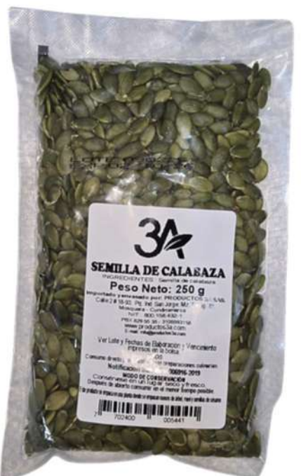
SEMILLA DE CALABAZA X 500g