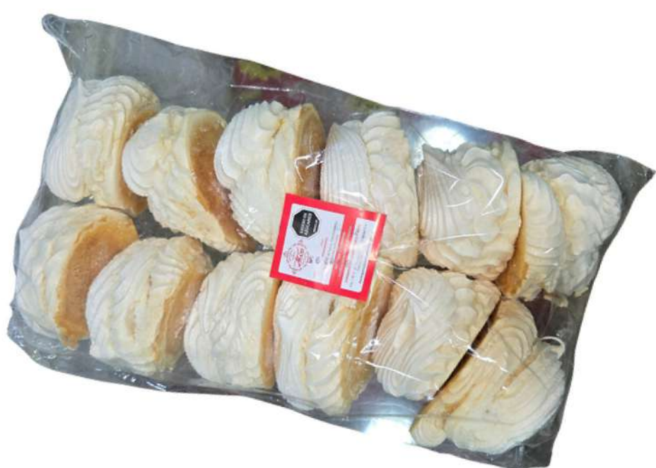
MERENGUE X 12U