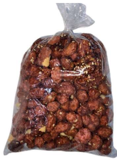
MANI DE DULCE X 500g